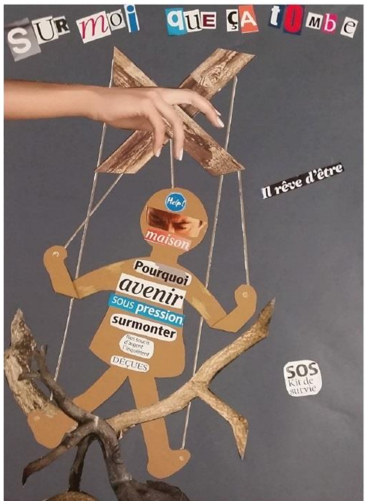
Illustration CATTIP - Expression artistiques

Renseignements & inscriptions Patricia MENUGE CMP - 18 rue de la Préfecture - 88000 Épinal Tel : 03 29 64 11 88 (de 13 h à 16 h du lundi au vendredi) patricia.menuge@sante-lorraine.fr